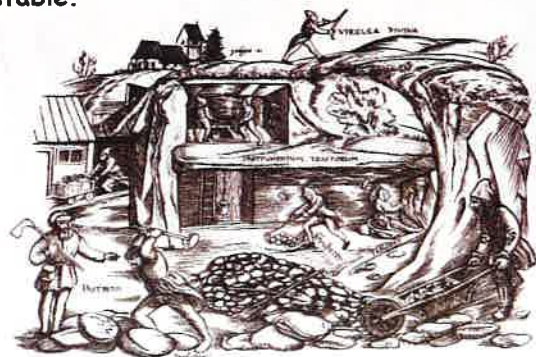
Notre sous-sol, estampe du moyen-âge.

Remarques : quelques variations de 1cm ont lieu sur l'ensemble de notre territoire, seul trois zones ont eu un mouvement de -3cm. Dans l'ensemble le réseau est stable.