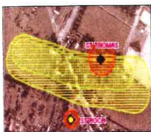
Extrait d'une carte d'aléas