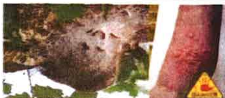
LES CHENILLES POSSESSIONNAIRES ENVAHISSENT LA LORRAINE

LORRAINE : ALERTE À LA CHENILLE URTICANTE